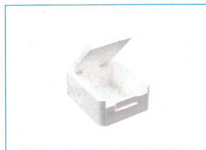
C - opakowanie drugorzędowe CC - czyste opakowanie drugorzędowe

Opracowanie: Fundacja Bank Mleka Kobięcego, Centrum Nauki o Laktacji, Fundacja Mlekiem Mamy