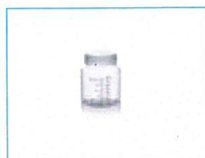
A - opakowanie właściwe